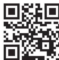
ホームページQRコード

ホームページ https://shiga-nokaikyo.or.jp/ Q&Aを掲載しています。